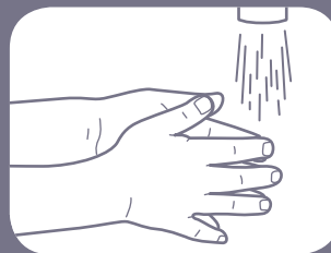
Gosok saat membilas