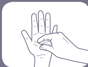
Gosok ujung jari di telapak tangan