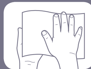
Keringkan secara menyeluruh