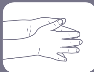
Gosok telapak tangan, jari-jari bertautan