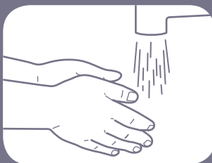
Basahi tangan dan pergelangan tangan

Ikuti langkah-langkah sederhana berikut untuk menghilangkan kuman berbahaya dengan mencuci tangan Anda setidaknya selama 20 detik .